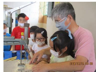
※3年生以上は「貯金箱」