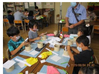
※1, 2年生は「ペン立て表装」