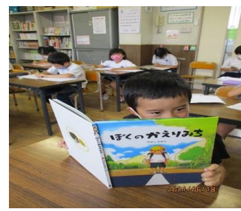
※新しい本を購入しました。