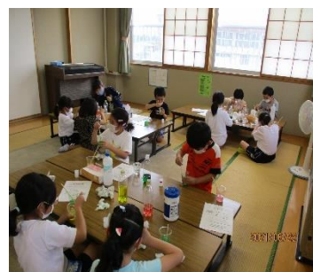
※6/22(火)に行われた『科学クラブ』の様子です。(スライム作り)